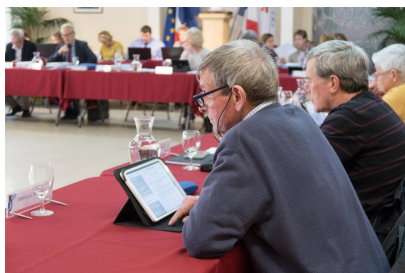
Conseil municipal du 10/04/2019