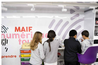
Bus Mais numérique tour