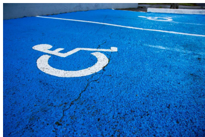
Stationnement PMR

La ville de Miramas a mis en place un programme de création de places de stationnement réservées GIG-GIC, en centre-ville, mais aussi dans de nombreux quartiers.