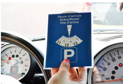
Disque européen de stationnement

Pour dynamiser le centre-ville et permettre une fluidité du stationnement gratuit à proximité des principaux commerces et services publics, la ville de Miramas a mis en place une zone bleue de stationnement sur un périmètre adapté aux besoins.