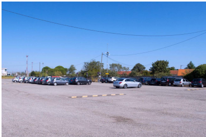
Parking relais

Situé à proximité de la gare, le parking relais est un parc de stationnement sécurisé sous vidéosurveillance. Il est particulièrement adapté aux voyageurs devant stationner un ou plusieurs jours.